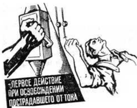
Рис. 1. Освобождение пострадавшего от действия электотока путем отключения электроустановки

6.1. Быстрое отключение от действия электрического тока это первое действие для спасения пострадавшего.