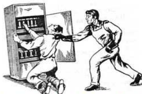
Рис. 4. Освобождение пострадавшего от токоведущей электрической части

6.2. При поражении электрическим током необходимо быстро освободить пострадавшего от действия тока - немедленно отключить ту часть электроустановки, которой касается пострадавший. Когда невозможно отключить электроустановку, следует принять иные меры по освобождению пострадавшего, соблюдая надлежащую предосторожность