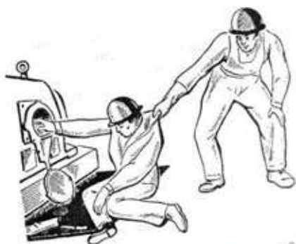
Рис. 3. Освобождение пострадавшего от действия части, находящейся под напряжением до 1000 В